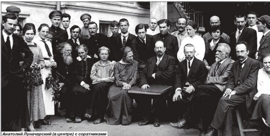
Анатолий Луначарский (в центре) с соратниками

Конечно, Луначарский вел далеко не пуританский образ жизни. Дружба с масонами и представителями богемы, любовь к сомнительным развлечениям вроде спиритических сеансов, организация вечеринок, больше напоминавших оргии, - все это имело место.