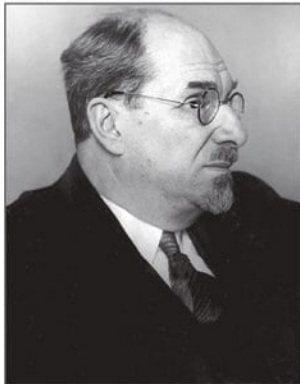
С Максимом Горьким