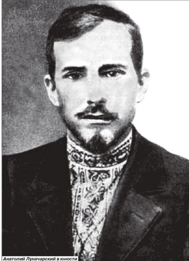
Анатолий Луначарский в юности

Основным направлением его деятельности было налаживание контактов с оставшимися в живых и не уехавшими в эмиграцию представителями дореволюционной интеллигенции. Сделать их сторонниками советской власти было очень нелегко, почти невозможно, но Луначарский справлялся с задачей блестяще. Образованность, эрудиция, незаурядный ум и природное обаяние настолько подкупали бывших «буржуев», что мно-