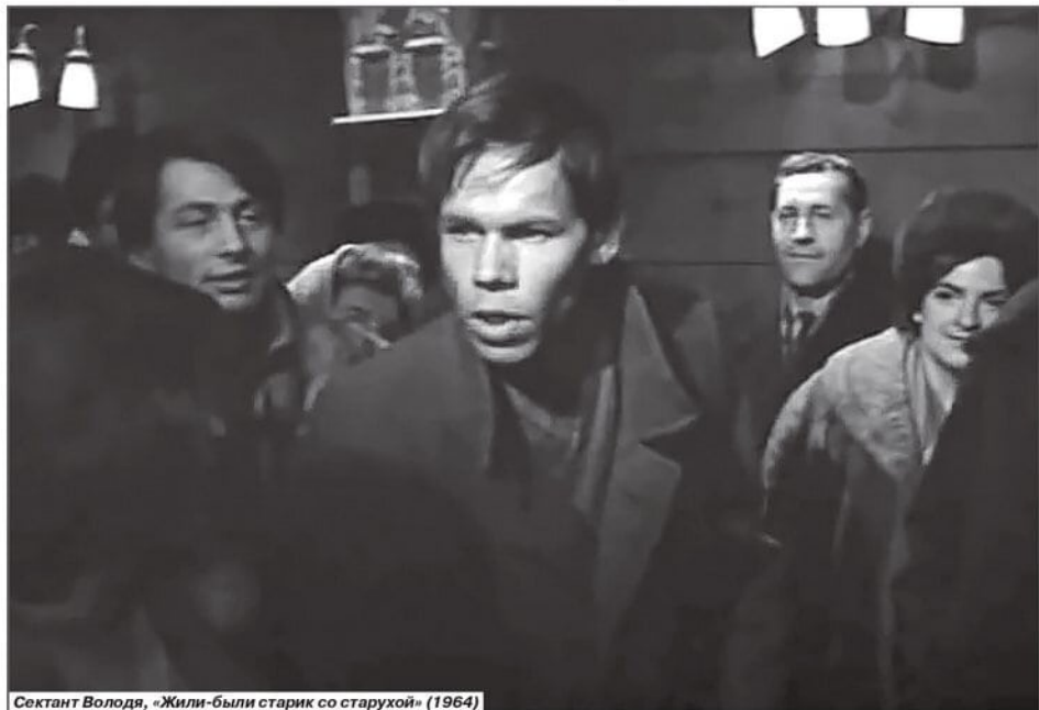
Сектант Володя, «Жили-были старик со старухой» (1964)

Премьера кинофильма «Одиночество» состоялась 15 ноября 1965 года.