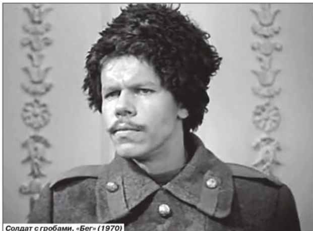
Солдат с гробами, «Бег» (1970)