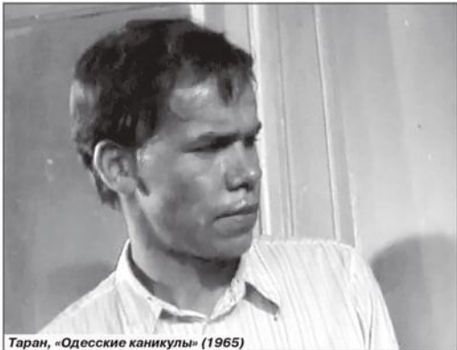
Таран, «Одесские каникулы» (1965)