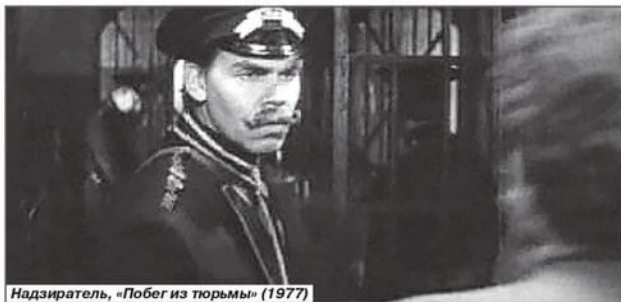
Надзиратель, «Побег из тюрьмы» (1977)