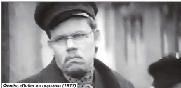
Филёр, «Побег из тюрьмы» (1977)