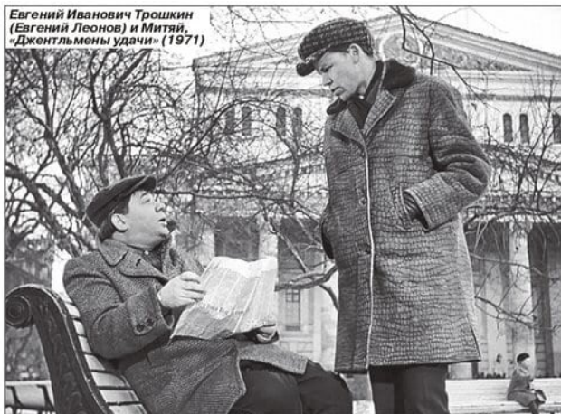
Евгений Иванович Трошкин (Евгений Леонов) и Митяй, «Джентльмены удачи» (1971)