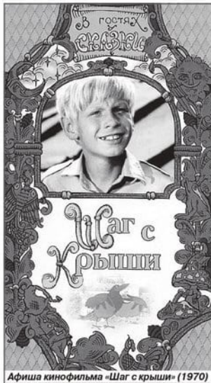
Афиша кинофильма «Шаг с крыши» (1970)