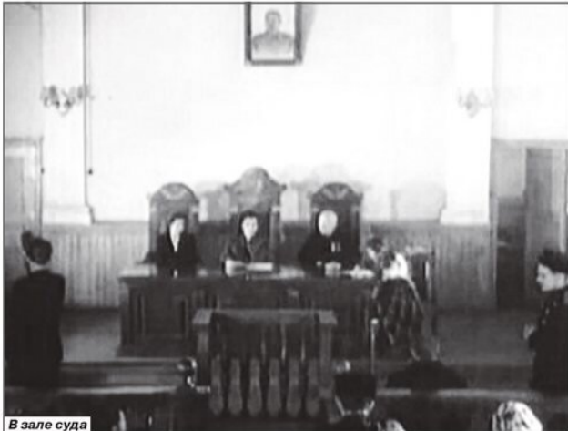
В зале суда

Единственным тёмным пятном остались фигурировавшие в деле 292,500 рублей, которые так и не были найдены.