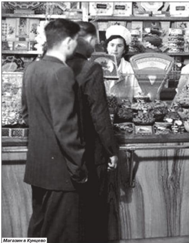
Магазин в Кунцево

Гремели выстрелы, гибли люди. В Москве на кухнях шепотом рассказывали о страшной банде, терроризирующей столицу.