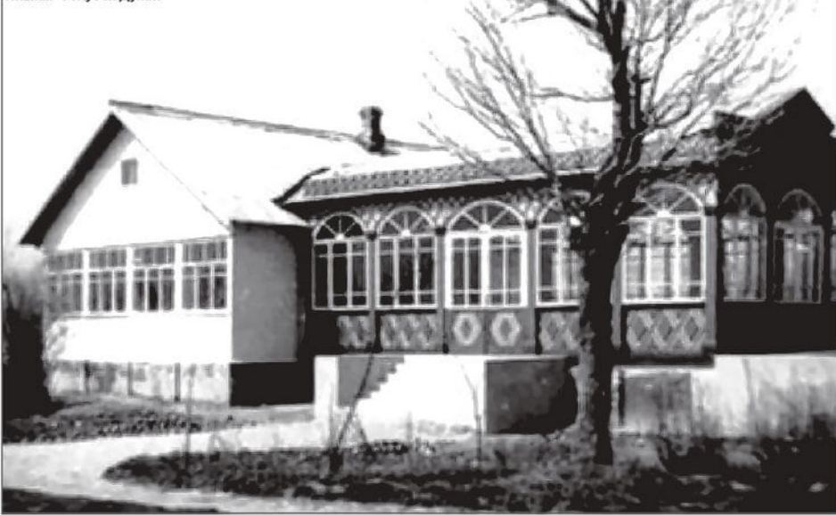
Пивная «Голубой Дунай»

ров убивали редко: 1951 год - 4 погибших, 1952 - 5. Каждая гибель расценивалась как ЧП. На место трагедии выехали лучшие сотрудники, однако группа вернулась «пустой»: никаких зацепок.