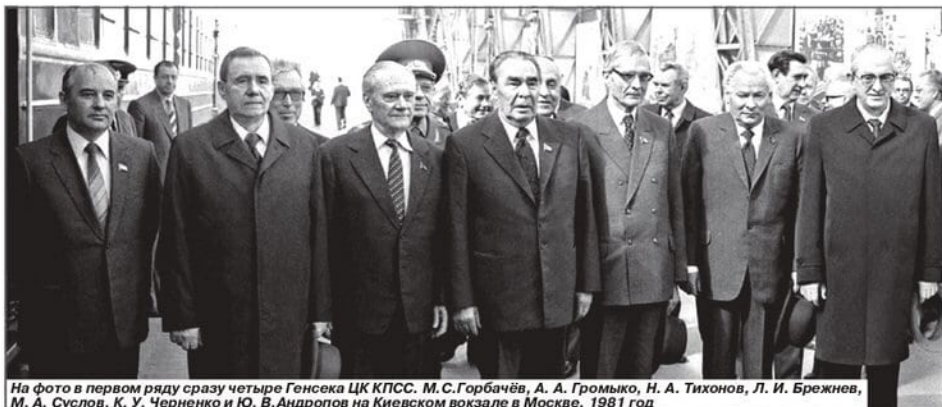
На фото в первом ряду сразу четыре Генсека ЦК КПСС. М. С. Горбачёв, А. А. Громыко, Н. А. Тихонов, Л. И. Брежнев, М. А. Суслов, К. У. Черненко и Ю. В. Андропов на Киевском вокзале в Москве, 1981 год

- Многие не работают! Я не против колхозов, но там, где они не работают, зачем они нужны? Только ради идеологии?