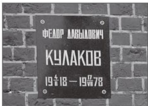
Место захоронения Ф. Д. Кулакова в Кремлевской стене

По словам хорошо его знавших соратников, Кулаков не был равнодушным человеком, цинично наблюдавшим за бедственным положением сельского хозяйства. Ему было больно видеть, как деревня погибает, зарастает лесом, люди разбегаются. Он был за экономические реформы и прямо говорил об их необходимости: