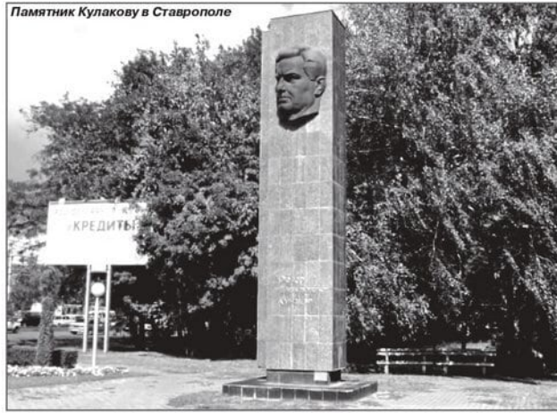
Памятник Кулакову в Ставрополе