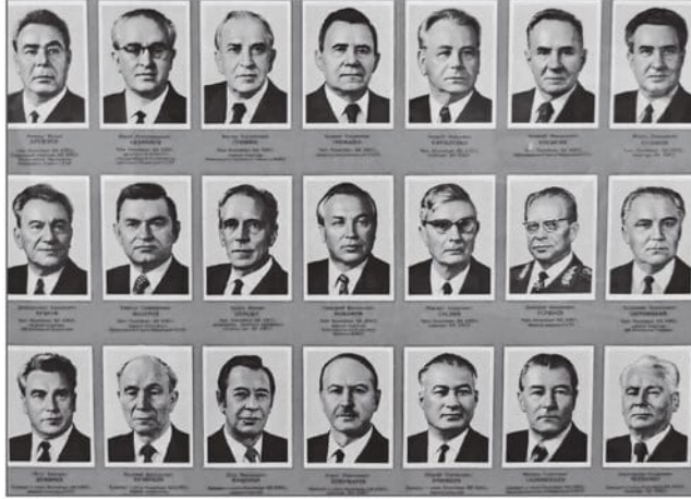
Политбюро ЦК КПСС. Ф. Д. Кулаков - крайний справа в первом ряду

цем в высших эшелонах власти бывшего СССР, особенно - в постсталинский период. Конечно же, её апогеем являлась борьба за кресло Генсека ЦК КПСС, как при Хрущёве, так и при Брежнев.