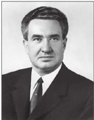
Федор Давыдович Кулаков (официальная фотография)

В 1960-ом году в 42 года он был направлен на Ставрополье первым секретарём крайкома. Этот период своей жизни Кулаков потом всегда вспоминал со светлым чувством: ему нравилась работа, нравился климат, богатый и щедрый край. Да и образ жизни вполне устраивал обожавшего застолья и большие компании партийного руководителя. Он слыл хлебосолом, собирал по различным поводам гостей и своих соратников, благо санаториев и домов отдыха в предгорьях и горах Кавказа имелось великое множество, и было где собраться. Кстати, любовь к охоте он впоследствии сохранил и в Москве, подобрав для этого ряд близлежащих охотничьих хозяйств.