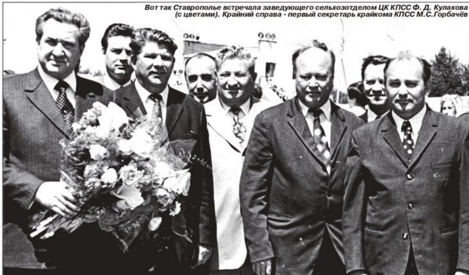
Вот так Ставрополье встречала заведующего сельхозотделом ЦК КПСС Ф. Д. Кулакова (с цветами). Крайний справа - первый секретарь крайкома КПСС М. С. Горбачёв