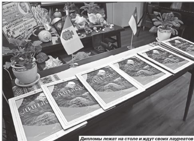
Дипломы лежат на столе и ждут своих лауреатов