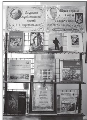
Книги - лауреаты премии имени Константина Паустовского 2023 года

- Илья Рейдерман, поэт, в номинации «Поэзия» (2010, 2012); - Евгений Голубовский, журналист, культуролог, в номинации «Поэзия» (2015) и в номинации «Проза» (2018);