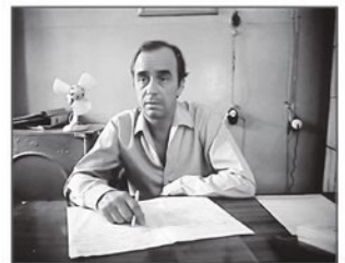
Олег Борисов в кинофильме «Остановился поезд»