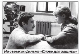
На съемках фильма «Слове для защиты»

- Сейчас главный человек - продюсер. Чтобы вернуть качество отечественному кинематографу, необходима полнокровная художественная идея, и чтобы режиссер оставался с картиной один на один, был Автором. Я-то абсолютно уверен, что вообще киноязык как таковой еще не собрался. Кино - искусство молодое. В буквальном смысле этого слова. Но даже молодое кино - это жизнь.