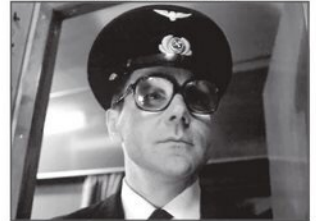
Сергей Маковецкий в кинофильме «Пьеса для пассажира»