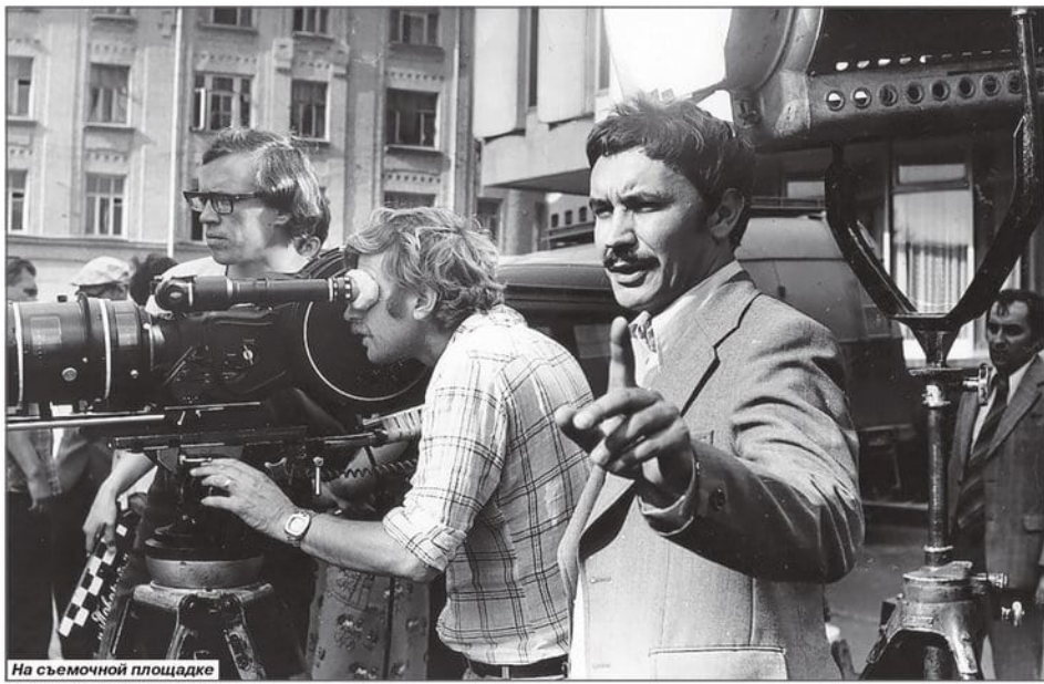
На съемочной площадке

подвергал коллизии пристальному психологическому расследованию. Вернее, катастроф случилось несколько, минимум две: одна - в толще обыденности, другая - в душе персонажа.