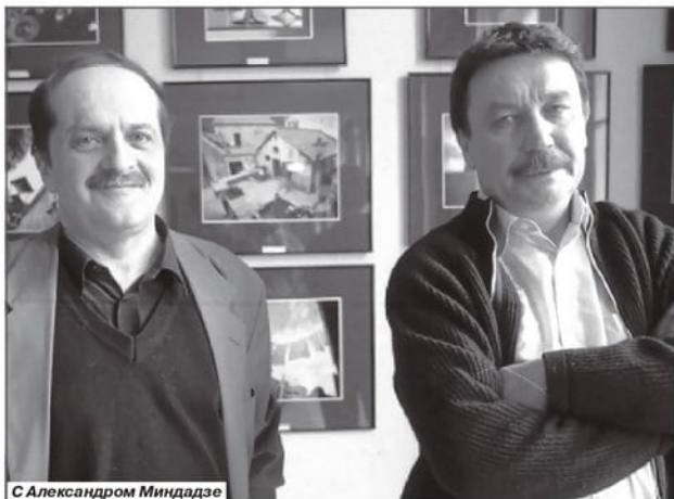
С Александром Миндадзе