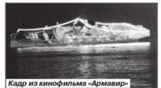
Кадр из кинофильма «Армавир»