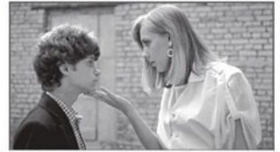
Кадр из кинофильма «Пломбум, или Опасная игра»