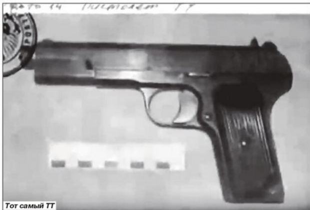
Тот самый ТТ