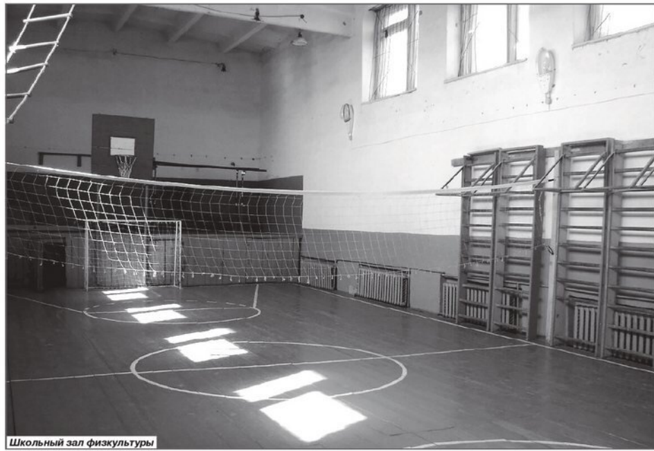
Школьный зал физкультуры