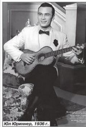
Юл Юринер, 1936 г.