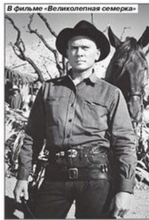
В фильме «Великолепная семерка»

Весной 1961 в советский прокат вышел американский вестерн «Великолепная семерка». Картина пользовалась в СССР фантастической популярностью — попала в кинзал стремилась люди всех возрастов, а мальчишки во дворах с азартом разыгрывали сценки из боевика и стремились походить на главного героя — Криса Адамса. Но ни взрослые, ни дети даже представить не могли, что артист, сыгравший роль отважного ковбоя, был... «нашим человеком».