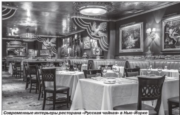
Современные интерьеры ресторана «Русская чайная» в Нью-Йорке