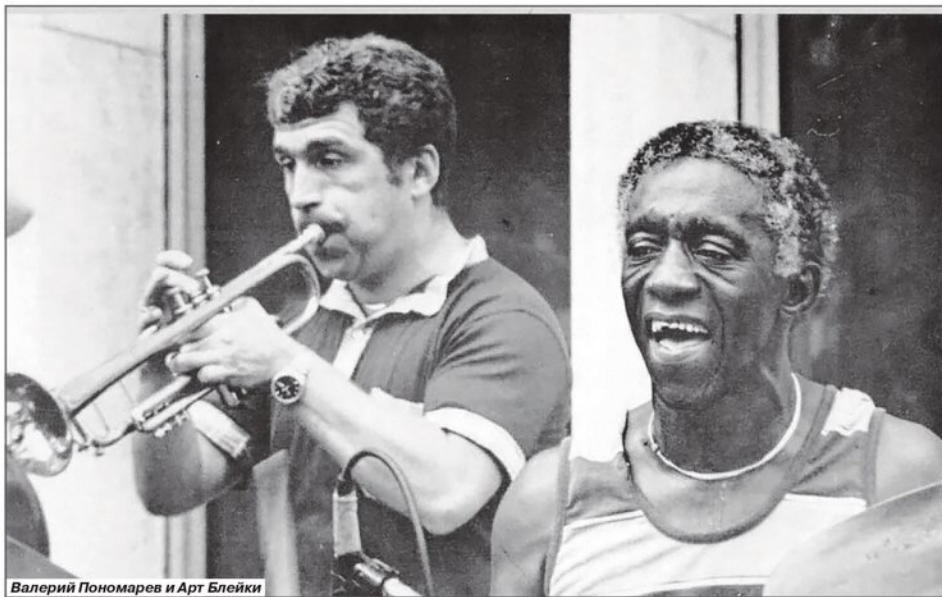
Валерий Пономарев и Арт Блейки

...Времени не существовало. Я весь растворился в звуках своей трубы. Мне хотелось выплеснуть все, чему я научился за эти годы. И, видимо, это удалось.