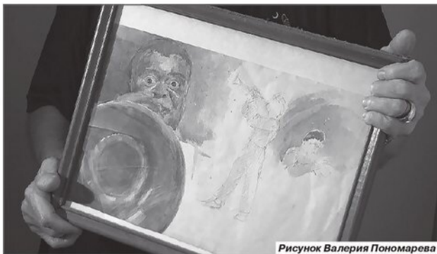
Рисунок Валерия Пономарева

Беседовал Максим Кравчинский www.kravchinsky.com