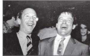
Савелий Крамаров и Робин Уильямс на премьере фильма «Москва на Гудзоне».

звали Савелием. С безумным видом он мечется по экрану, безупрская трех-тажные непечатности. Они грохочут в квадрофонических динамиках. Ничего другого по части творческой свободы Савелий не получил. К главной роли его не подпустили. Иваноффа играет американец Робин Вильямс, а Савелий довольствуется воссозданием отнюдь не гамлетовского образа - уличного продавца сосисок. Не удивлюсь, если завтра действительно встречу Савелия на улице с тележкой. Это еще будет для него большой удачей».