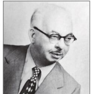
Писатель Аргус (Михаил Константинович Айзенштадт)