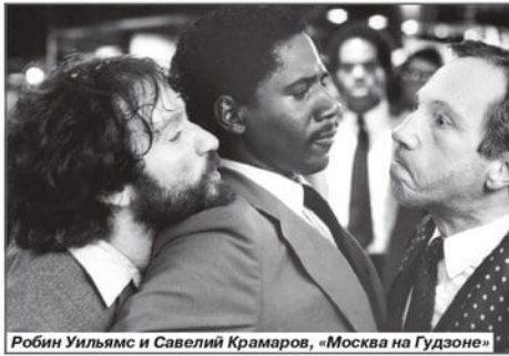
Робин Уильямс и Савелий Крамаров, «Москва на Гудзоне»