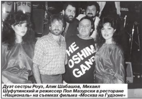
Дуэт сестры Роуз, Алик Шабашов, Михаил Шуфутинский и режиссер Пол Мазурски в ресторане «Националь» на съемках фильма «Москва на Гудзоне»