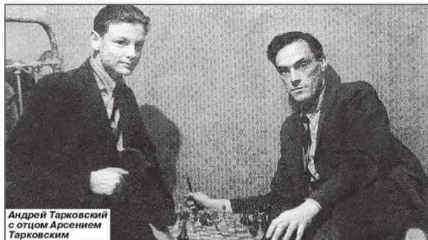
Андрей Тарковский с отцом Арсением Тарковским

Гениальный режиссер Андрей Арсеньевич Тарковский обрел последнее пристанище на русском кладбище Сен-Женевьев-де-Буа под Парижем. На его могиле выбиты слова: «Человеку, который увидел ангела». Все так... Но случаются моменты, когда даже обитатели небесных пределов спускаются на грешную землю.