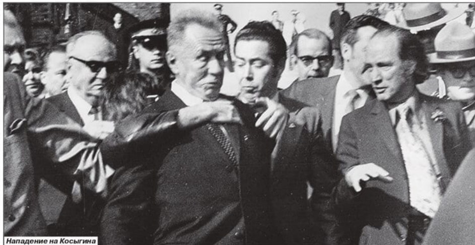
Нападение на Косыгина