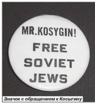
Значок с обращением к Косыгину