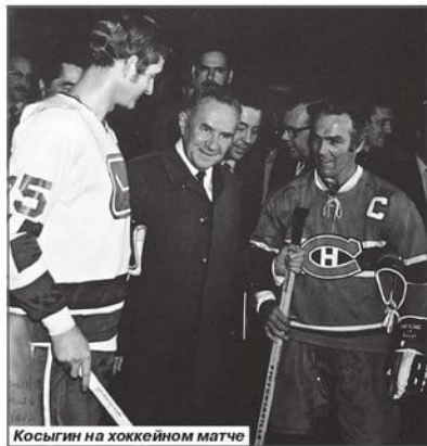
Косыгин на хоккейном матче

Недавно ко мне в коллекцию попал интересный экспонат - значок с призывом к Председателю Совета министров СССР А. Н. Косыгину «освободить советских евреев». находка заставила провести небольшое расследование, результаты которого оказались довольно любопытными.