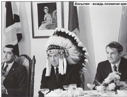
Косыгин - вождь племени кри

Оказалось, что осенью 1971 года Алексей Николаевич Косыгин совершил рабочий визит в Канаду. График поездки был очень плотный: он посетил Оттаву, Торонто, Монреаль, Эдмонтон и Ванкувер. В каждом городе с ним происходили разные случаи,