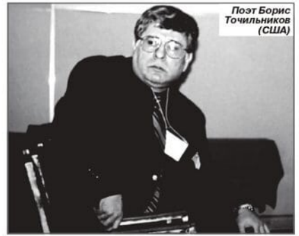
Поэт Борис Точильников (США)

Испании, Италии, Казахстане, Кыргызстане, Латвии, Литве, Никарагуа, Чехии, Эстонии, ЮАР и других странах.