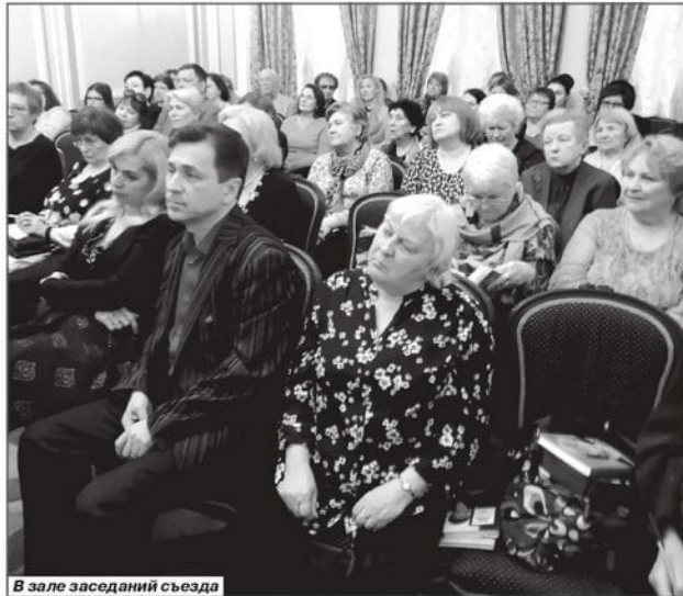
В зале заседаний съезда