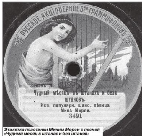
Этикетка пластинки Минны Мерси с песней «Чудный месяц в штанах и без штанов»