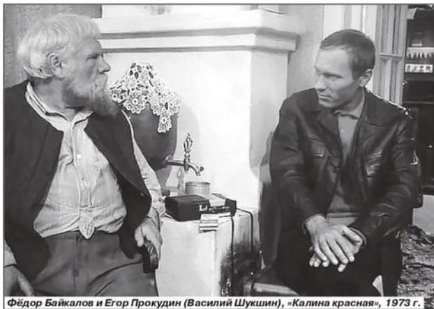
Фёдор Байкалов и Егор Прокудин (Василий Шукшин), «Калина красная», 1973 г.

дослужился до должности бригадира. Одновременно выступал в любительском театре. В 17 лет решил отправиться в столицу, где поступил в училище при Московском театре Революции. В 1935 году окончил училище и стал актером этого театра. В 1940 году стал актером