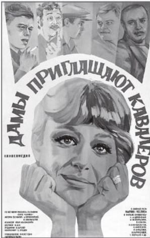
Афиша кинофильма «Дамы приглашают кавалеров», 1980 г.

Крамаровым они сыграли пьящих отдыхающих – Васю и Петю соответственно.