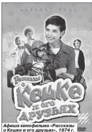
Афиша кинофильма «Рассказы о Кешке и его друзьях», 1974 г.