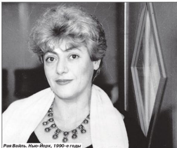
Рая Вайль. Нью-Йорк, 1990-е годы

рассказы об автографах писателя, их поисках и адресатах