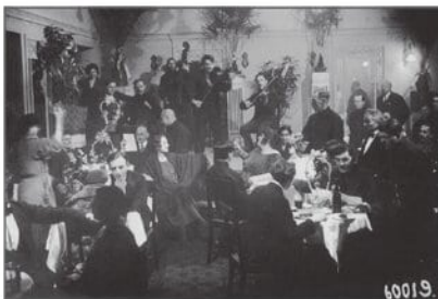
Зал гостиницы «Европейская» в Петрограде, 1922.

В Петрограде к весне 1922-го работали множество ресторанов: «Жизнь театра» (на Морской набережной), «Хромой Джо» (на Итальянской улице), «Прага» (на Садовой), «Сверчок на печи» (на Невском проспекте), «Золотой якорь» (на Василеостровском), «Олень» (на Большом проспекте). Старожилы рассказывают, что под рестораном «Золотой якорь» в полуподвале пряталась пивнушка, которую местные почему-то называли «Поддувалом». Недалеко от «Золотого якоря», в доме №22,