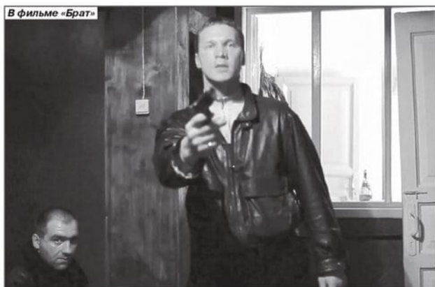
В фильме «Брат»