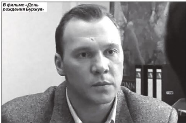
В фильме «День рождения Буржуя»