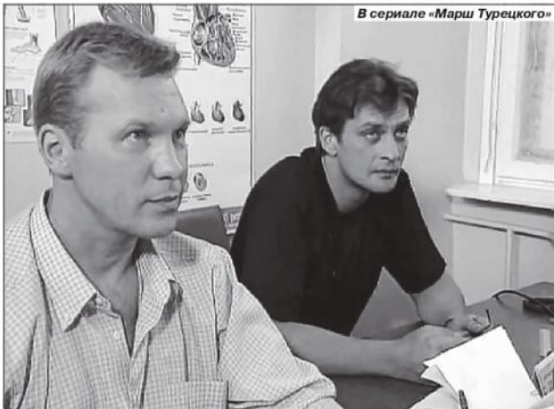
В сериале «Марш Турецкого»