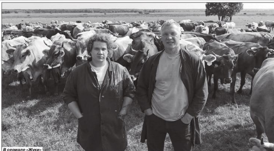
В сериале «Жуки»