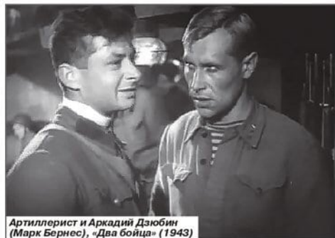
Артиллерист и Аркадий Дзюбин (Марк Бернес), «Два бойца» (1943)