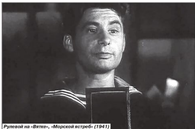
Рулевой на «Вятке», «Морской ястреб» (1941)