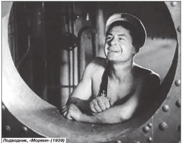
Подводник, «Моряки» (1939)