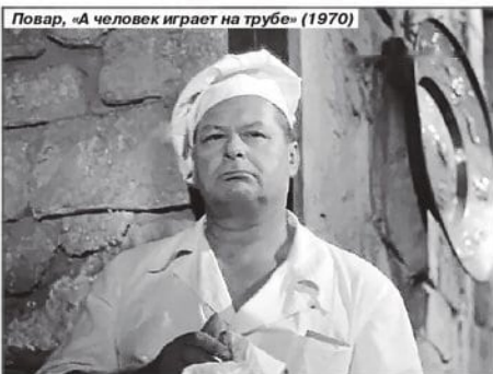
Повар, «А человек играет на трубе» (1970)