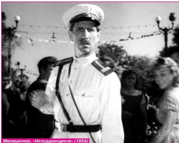
Милиционер, «Неподдающиеся» (1959)