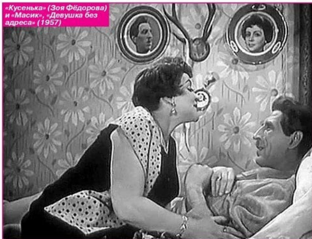
«Кусенька» (Зоя Фёдорова) и «Масик», «Девушка без адреса» (1957)