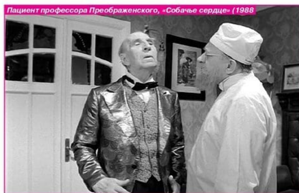
Пациент профессора Преображенского, «Собачье сердце» (1988)