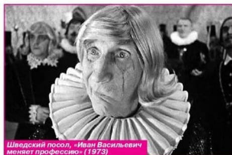
Шведский посол, «Иван Васильевич меняет профессию» (1973)