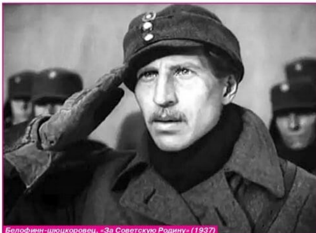
Белофинн-шокогорова, «За Советскую Родину» (1937)

Но если вспомнить киноработы Сергея Филиппова, которые запомнились зрителям, то, конечно же, вспоминаются: капрал-скороход («Золушка», 1947),