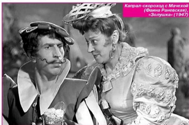
Капрал-скороход с Мачехой (Фина Раневская), «Золушка» (1947)