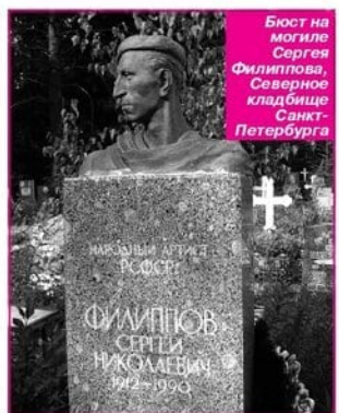
Бюст на могиле Сергея Филиппова, Северное кладбище Санкт-Петербурга