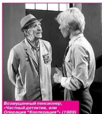
Возмущенный пенсионер, «Частный детектив, или Операция «Кооперация»» (1989)