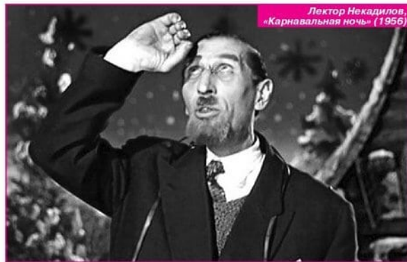
Лектор Некадилов, «Карнавальная ночь» (1956)