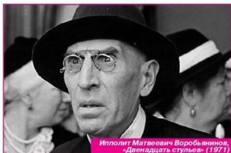
Ипполит Матвеевич Воробьянинов, «Двенадцать стульев» (1971)