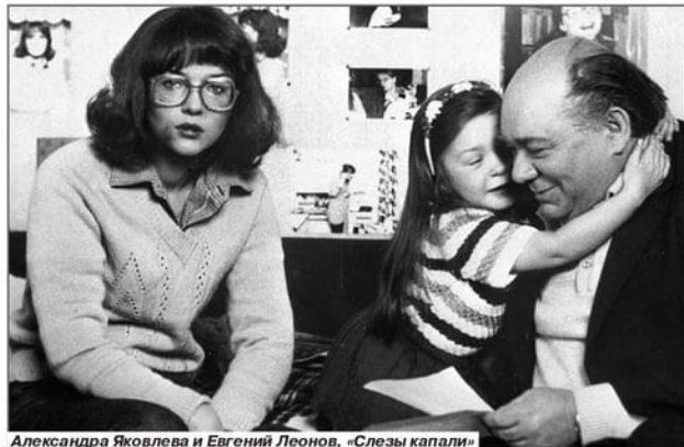
Александра Яковлева и Евгений Леонов, «Слёзы капали»