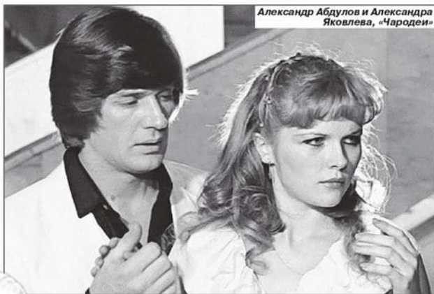
Александр Абдулов и Александра Яковлева, «Чародей»