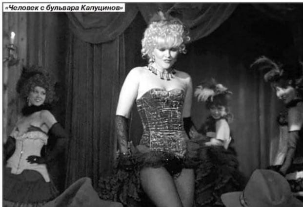
«Человек с бульвара Капуцинов»

Как не странно, но возможно именно то, что только некоторые детали, были взяты из повести Стругацких «Понедельник начинается в субботу», для зрителей «Чародеи» не стали экранизацией этой книги, а смотрелись как совершенно самостоятельная история.