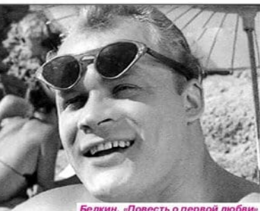
Белкин, «Повесть о первой любви»