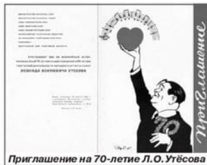
Приглашение на 70-летие Л.О. Утёсова