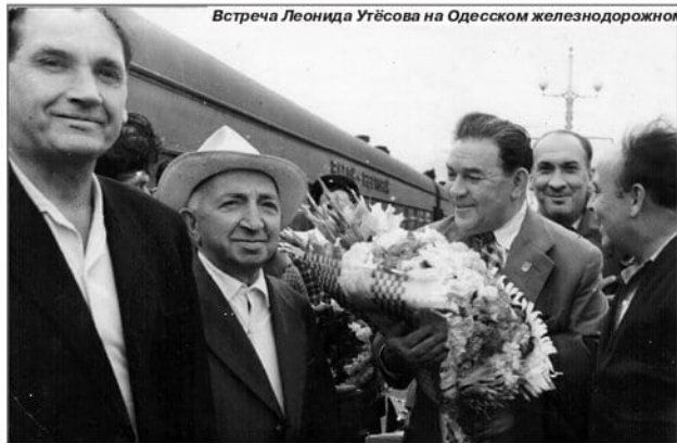
Встреча Леонида Утёсова на Одесском железнодорожном вокзале. Сентябрь 1961 или 1963 г.

Подшучивал над собой: «Всё правильно. Лучше заслуженно не быть заслуженным, чем незаслуженно быть народным». И всё же у него было звание. Артист. Любимый артист одесситов.