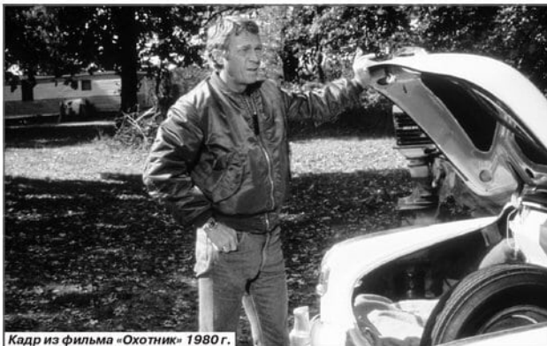
Кадр из фильма «Охотник» 1980 г.