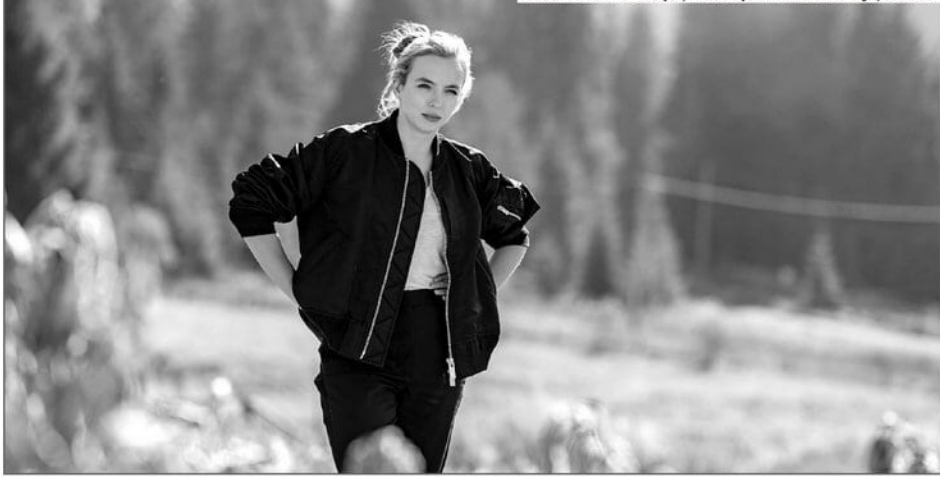
Виллanelь в бомбере, телесериал «Убивая Еву», 2018 г.

Это прекрасный пример того, как практичность, функциональность и необходимость никогда не выйдут из моды.