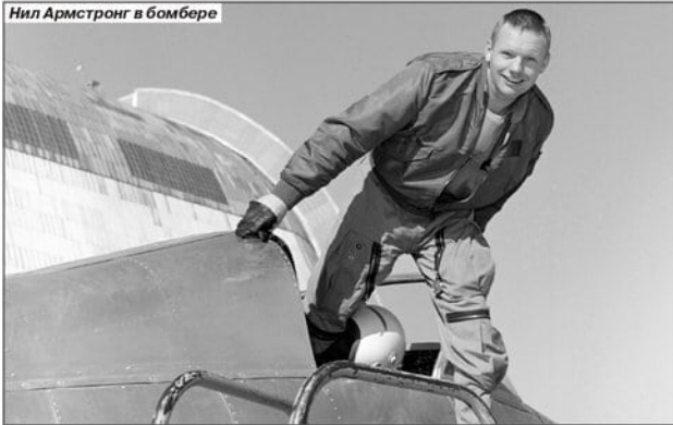
Нил Армстронг в бомбере