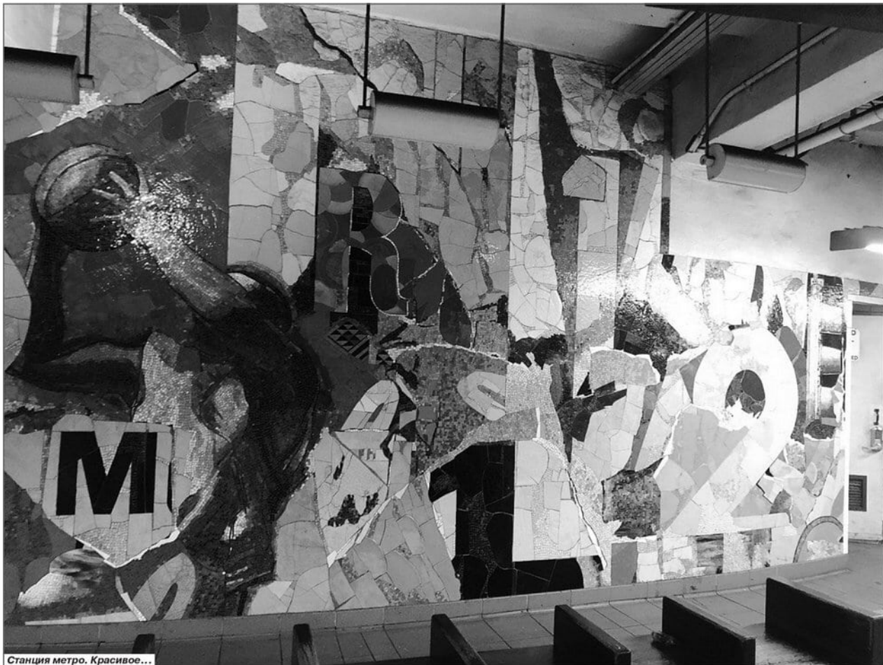
Станция метро. Красивое...

Я думаю, что моя жизнь — это не роман, а сюжет бразильской мелодрамы из 90-х. Такой линейный — про бедную, но работающую провинциалку, особенно когда с метро-карты списали 2,75, сука (только не думать и не переводить в гривны!), а турникет не открылся. Я его перепрыгиваю и смеюсь над собой. Пока ты смеешься — ты выигрываешь, а мелодрамы для домохозяйек продаются лучше архауса. Проклятая рекламная профдеформация!