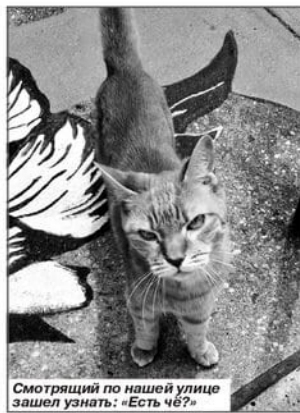
Смотрящий по нашей улице зашел узнать: «Есть чё?»

Попрошайка в метро как НЛП-шник подготовительного уровня вторгается в