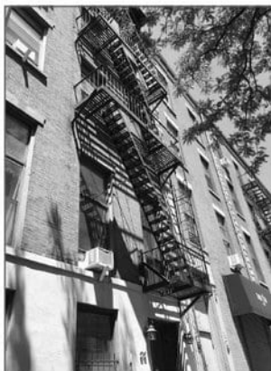
И до сих пор на всех пожарных лестницах высматриваю Одри Хепберн, мурлыкающую «Moon River»

же соискателей на место офисного админа. Я знаю теорию архетипов на практике и могу продать снег на Аляске местным жителям не больше кило в одни руки. Конечно, я продам себя. И меня сразу выбирают. Но рано почивать на лаврах — через три дня стажировки находится кто-то, кто уже работал в этой сфере. И больше приходить не надо.