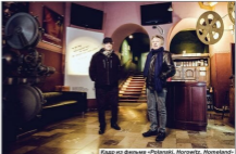
Кадр из фильма «Polanski, Morawitz, Holocaust»