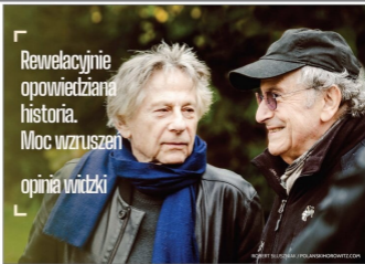
ROBERT BILUSZCZAK / POLANSKIHOROWITZ.COM

Rewelacyjnie opowiedziana historia. Moc wzruszenia opinia wictzki