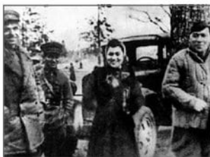
Эдит и Леонид Утёсовы (справа) на Волховском фронте, 1943 г.