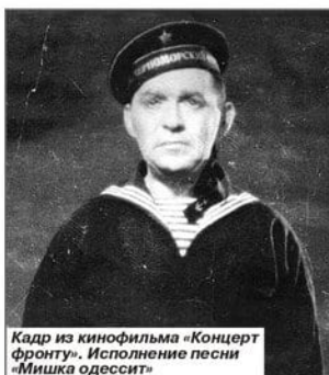
Кадр из кинофильма «Концерт фронту». Исполнение песни «Мишка одессит»