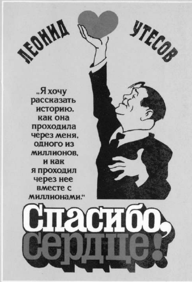
Супербложка книги Л. Утёсова «Спасибо, сердце!» (1976)