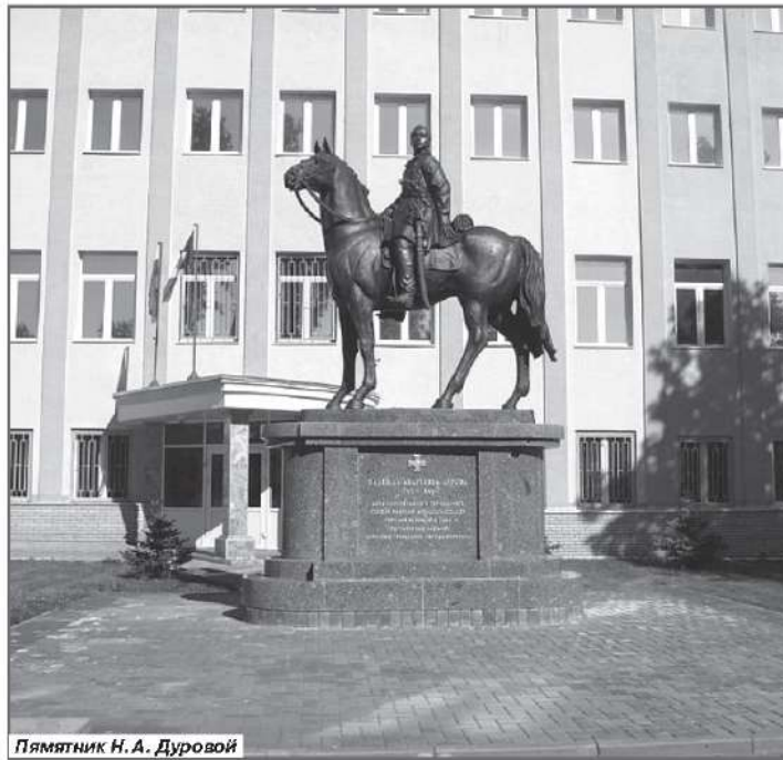
Памятник Н. А. Дуровой

Однако, вялость уездного города, сошедшая со страниц нетленного романа Ильи Ильфа и Евгения Петрова, орала