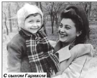
С сыном Гарриком