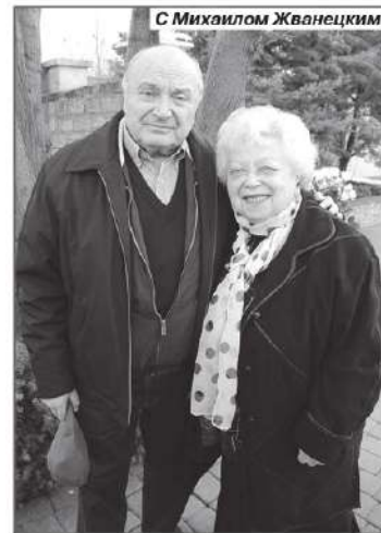
С Михаилом Жванецким

Омичи, в благодарность за то, что так и не услышали, как она играет, подарили ей на дом рояль, на котором она вернулась в Одессу, как только там выветрился запах Адольфа.