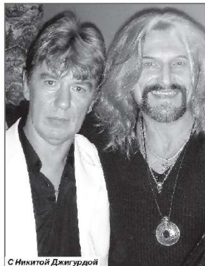
С Никитой Джигурдой

И солнце, много солнца во всем: в жизни, в любви, в песнях!